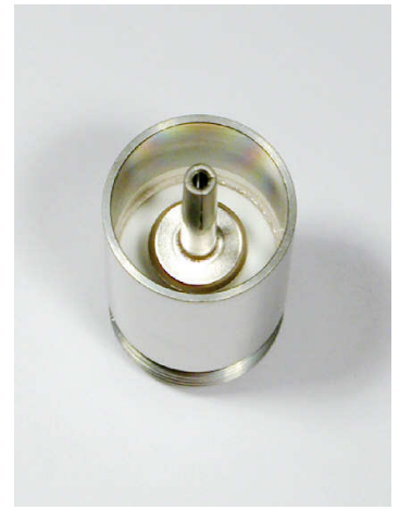
von Vak.Seite from vacuum side