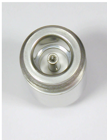
von Luftseite from air side