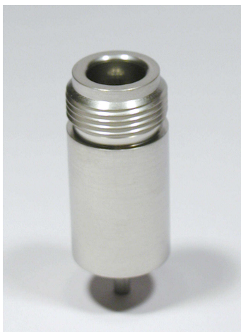
N50 Durchführung von der Seite Side view